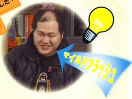
マイルドフラッグ